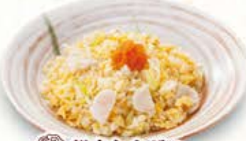
帆立とネギの 白出汁チャーハン 825円