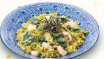
海老の翡翠チャーハン 854円