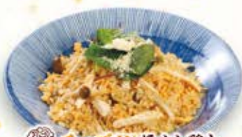
チーズINほぐし鶏と しめじのチャーハン 854円