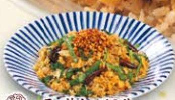
ラー油ナッツのせ 台湾チャーハン 854円

たらことバター醤油は チャーハンでも ベストマッチング！ 和・洋・中の美味しさが 一つに！