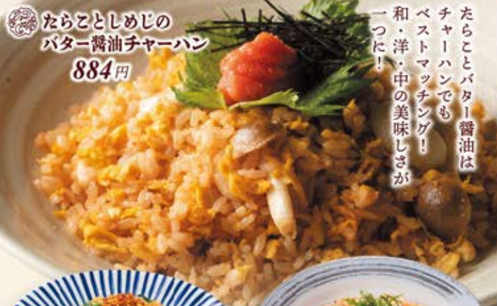
ならことしめじの バター醤油チャーハン 884円

たらことバター醤油は チャーハンでも ベストマッチング！ 和・洋・中の美味しさが 一つに！