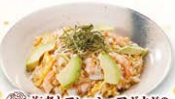
海老とフレッシュアボカドの マヨソースチャーハン 884円