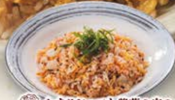
かちりジャコと紫蘇の実の 梅肉風味チャーハン 854円