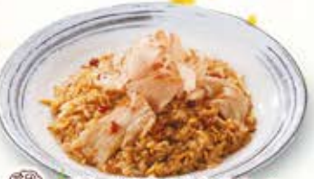
豚バラと豆もやしの ピリ辛チャーハン 854円