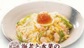
海老と水菜の あつさりチャーハン 854円