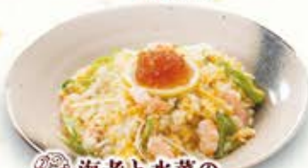
海老と水菜の あっさりチャーハン 854円