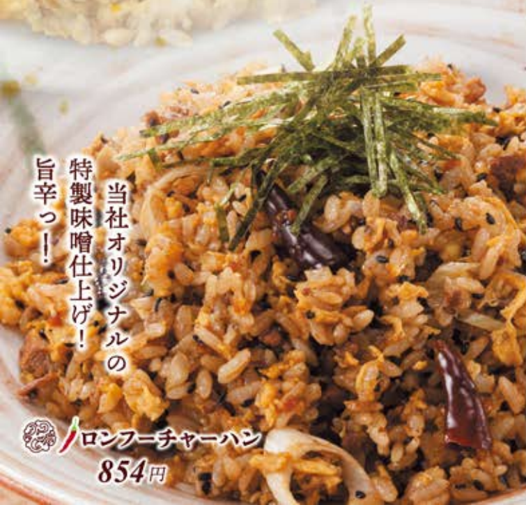
ロンフーチャーハン 854円