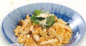
チーズINほぐし鶏と しめじのチャーハン 854円