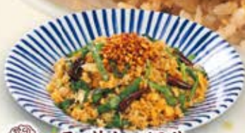
ラー油ナッツのせ 台湾チャーハン 854円

たらことバター醤油は チャーハンでも ベストマッチング！ 和・洋・中の美味しさが 一つに！