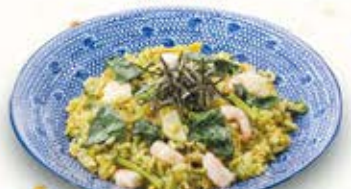
海老の翡翠チャーハン 854円