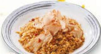
豚バラと豆もやしの ピリ辛チャーハン 854円