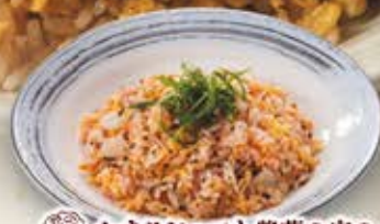
かちりジャコと紫蘇の実の 梅肉風味チャーハン 854円