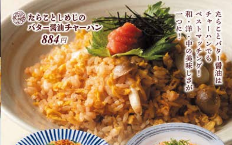
ならことしめじの バター醤油チャーハン 884円

たらことバター醤油は チャーハンでも ベストマッチング！ 和・洋・中の美味しさが 一つに！