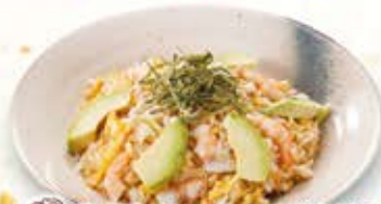
海老とフレッシュアボカドの マヨソースチャーハン 884円