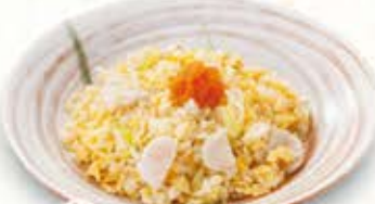
帆立とネギの 白出汁チャーハン 825円