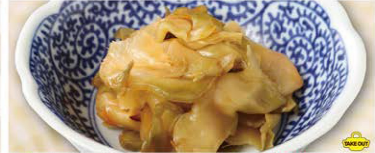
ザーサイ盛り 380円 (税込418円)