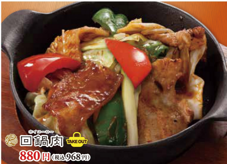
回鍋肉 880円 (税込968円)