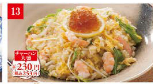
海老と水菜の あっさりチャーハン