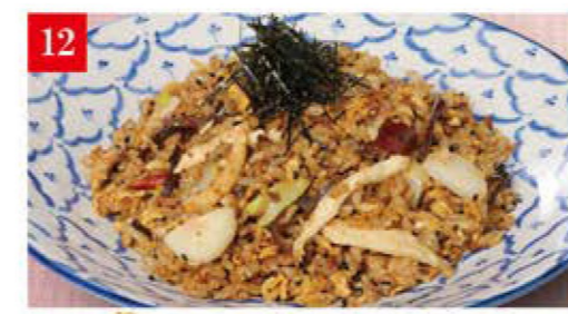
ロンフーチャーハン