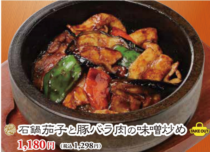
石鍋茄子と豚バラ肉の味噌炒め 1,180円 (税込1,298円)