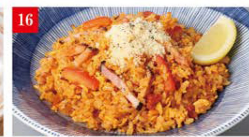
燻煙ベーコンの ドライトマトチャーハン