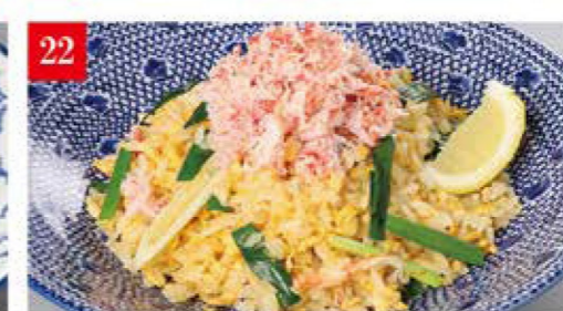
プレミアム蟹チャーハン