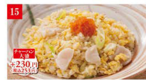
帆立とネギの白出汁 チャーハン