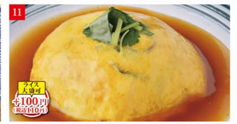
プレミアム天津飯