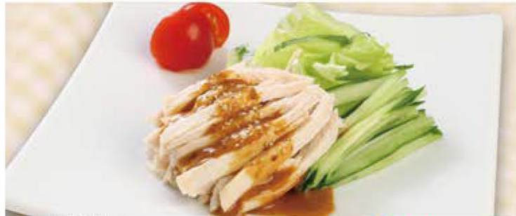
ばんばんじー 棒棒鶏 630円 (税込693円)