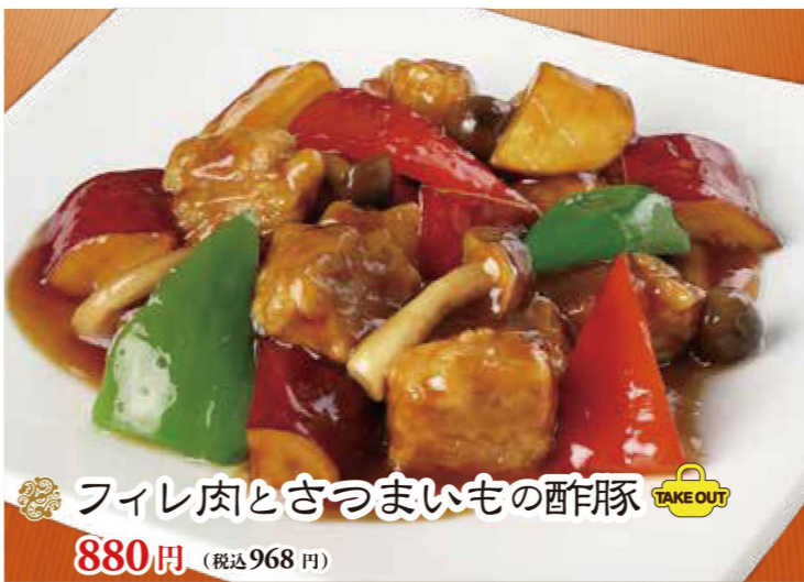
フィレ肉とさつまいもの酢豚 880円 (税込968円)