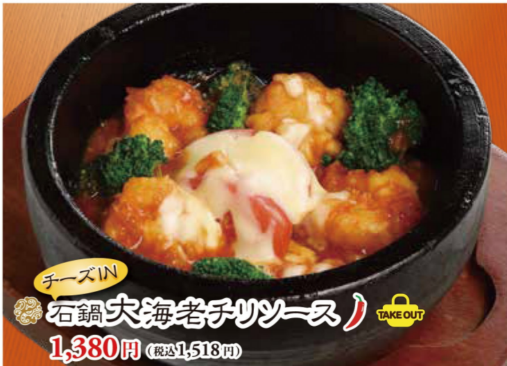
チーズIN 石鍋大海老チリソース 1,380円 (税込1,518円)