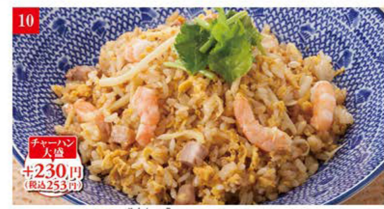
やんしゅう 楊州チャーハン