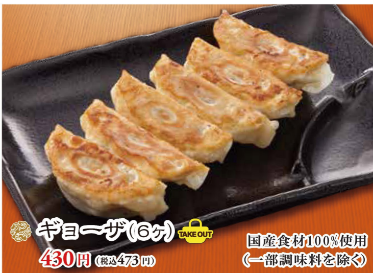
ギョーザ(6ヶ) 430円 (税込473円) 国産食材100%使用 (一部調味料を除く)