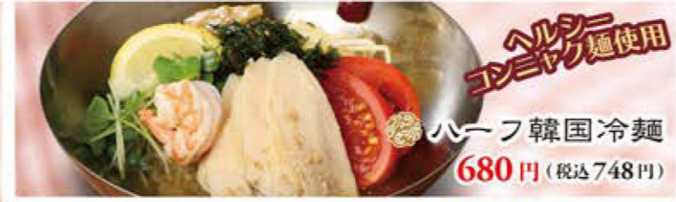
ヘルシー麺使用 ハーフ韓国冷麺 680円 (税込748円)