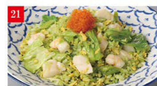
海鮮レタスチャーハン