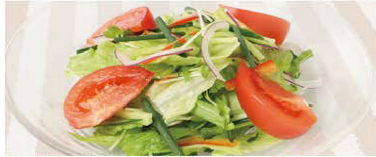
野菜8種のサラダ ~オリジナル和風ドレッシング~ 630円 (税込693円)