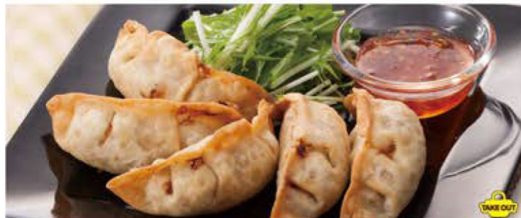
揚げギョーザ <5ヶ> 530円 (税込583円)