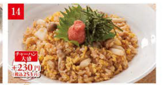
たらことしめじの バター醤油チャーハン