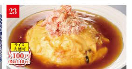
炙り蟹のプレミアム天津飯