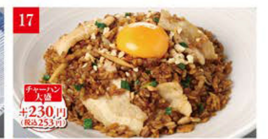
【月見】豚バラの黒チャーハン