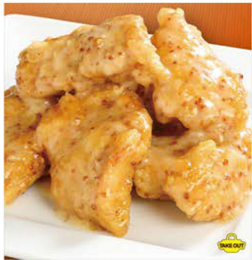
ハニーマスタードチキン <3ヶ> 480円 (税込528円) <5ヶ> 780円 (税込858円)