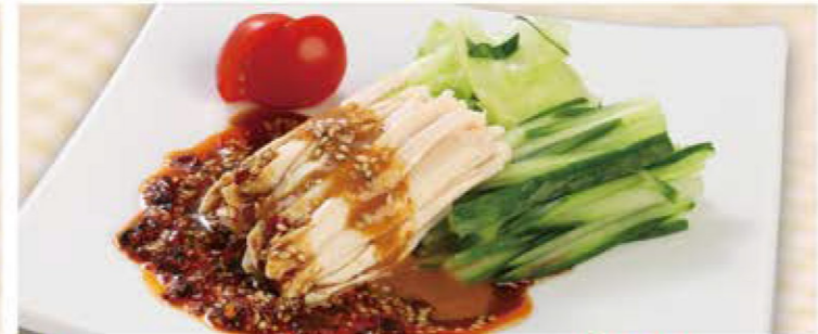
よだれ鶏 630円 (税込693円)