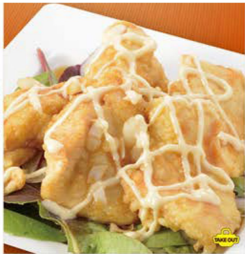
鶏ムネ肉のカラアゲ 特製マヨソースかけ <3ヶ> 480円 (税込528円) <5ヶ> 780円 (税込858円)