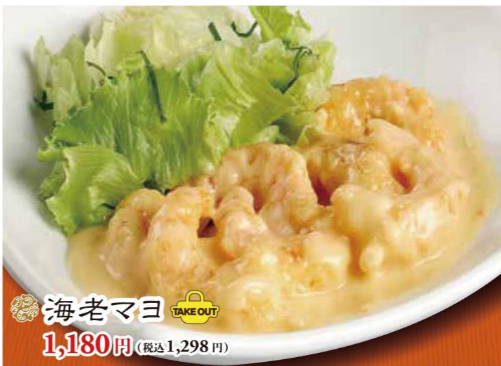
海老マヨ 1,180円 (税込1,298円)