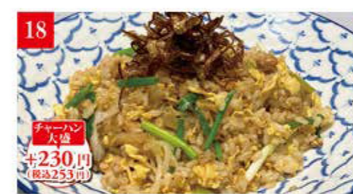
角切りチャーシューの 搾菜チャーハン