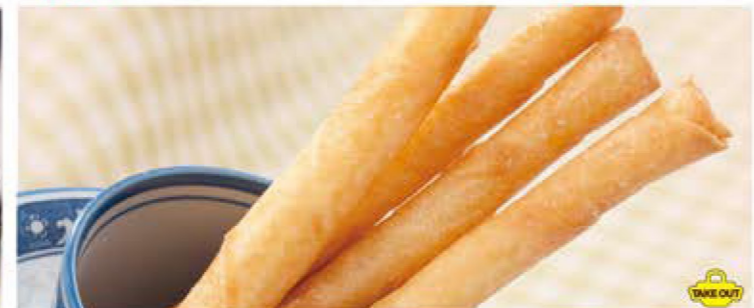
チーズスティック春巻き <4本> 530円 (税込583円)