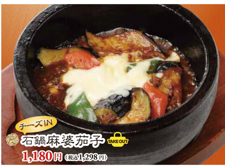
チーズIN 石鍋麻婆茄子 TAKE OUT 1,180円 (税込1,298円)