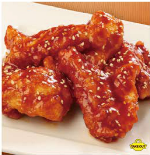
ヤンニョムチキン <3ヶ> 480円 (税込528円) <5ヶ> 780円 (税込858円)