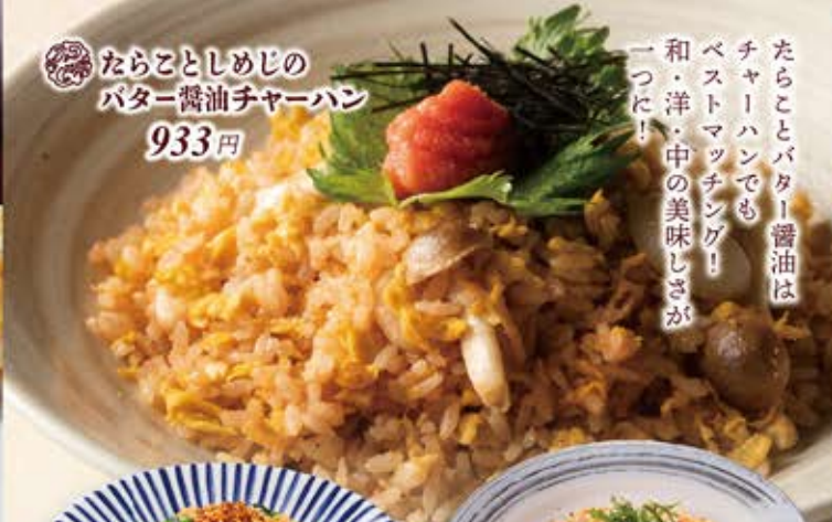
ならことしめじの バター醤油チャーハン 933円

たらことバター醤油は チャーハンでも ベストマッチング！ 和・洋・中の美味しさが 一つに！