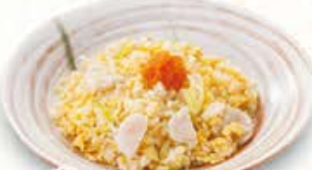
帆立とネギの 白出汁チャーハン 972円