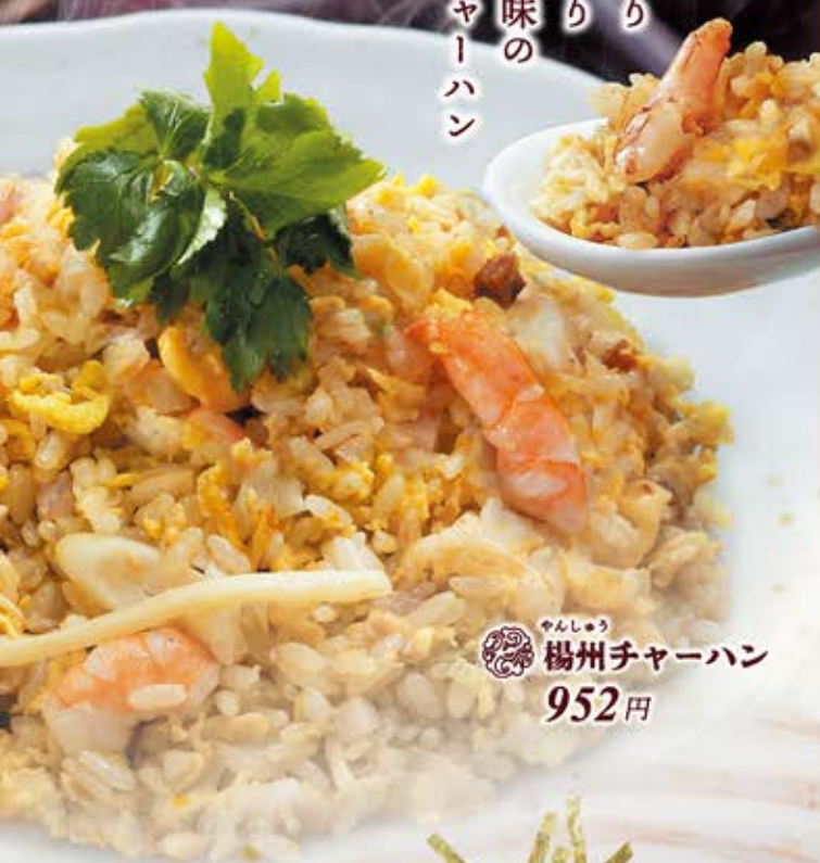
やんしゅう 楊州チャーハン 952円