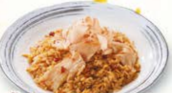
豚バラと豆もやし のピリ辛チャーハン 962円