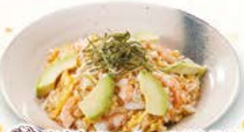
海老とフレッシュアボカドの マヨソースチャーハン 972円