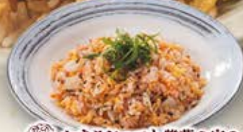
かちリジャコと紫蘇の葉の 梅肉風味チャーハン 962円