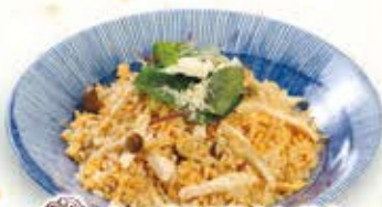
チニズINほぐし鶏と しめじのチャーハン 962円