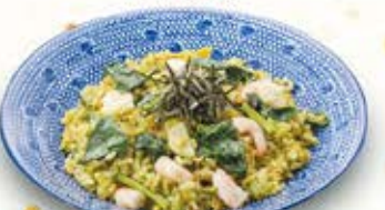
海老の翡翠チャーハン 962円